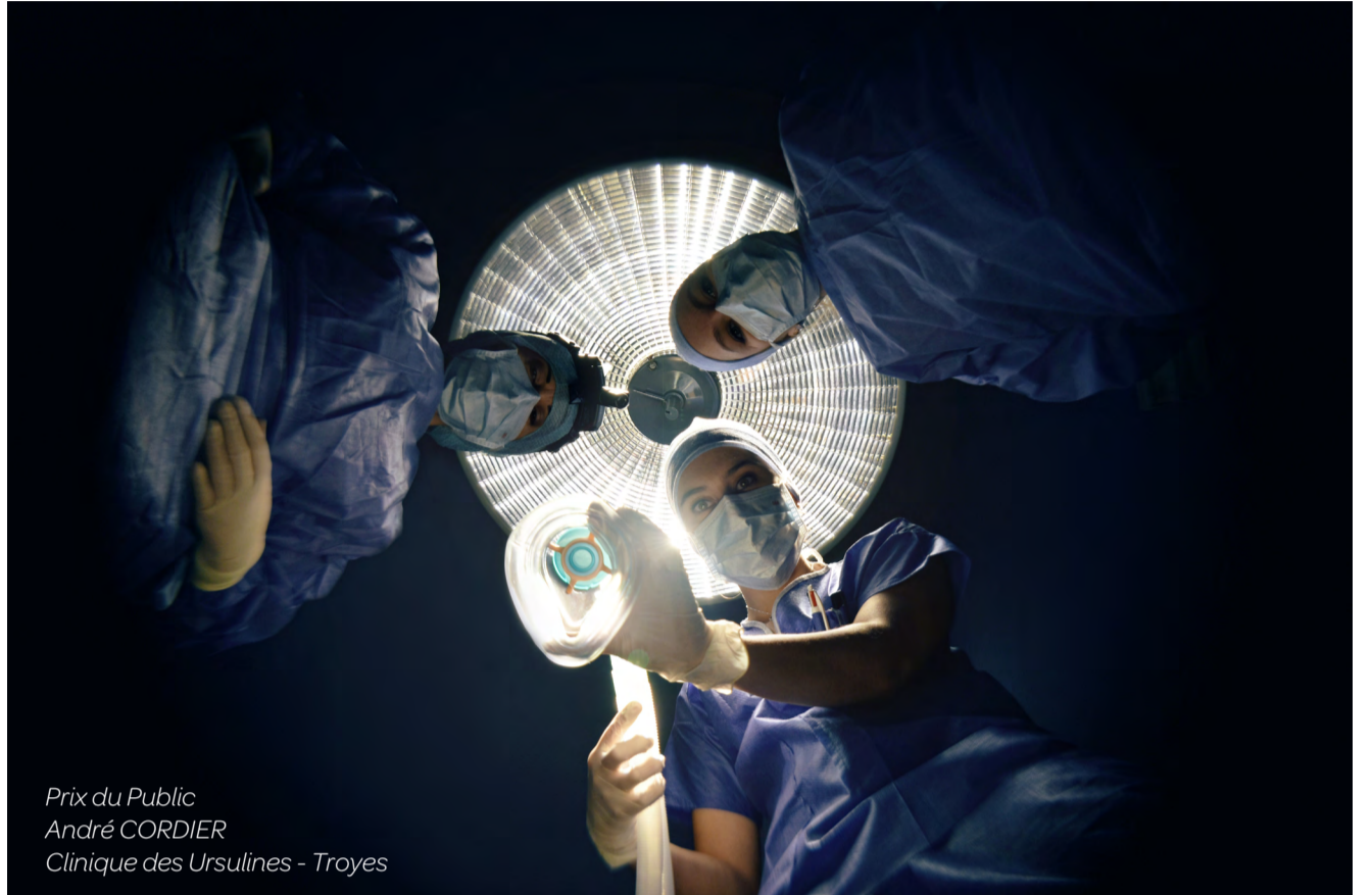
Prix du Public André CORDIER Clinique des Ursulines - Troyes