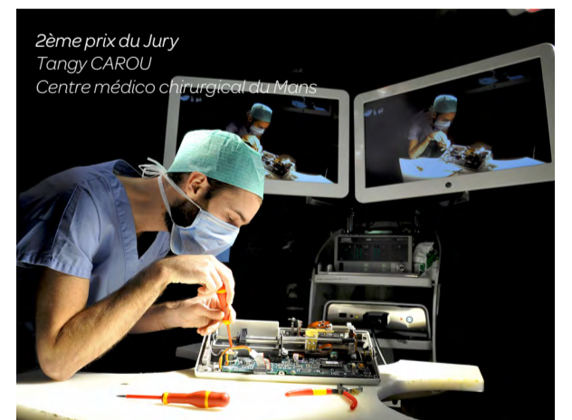
2 ème prix du Jury Tangy CAROU Centre médico chirurgical du Mans