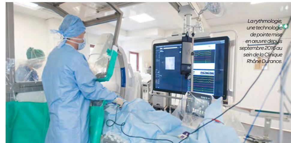
La rythmologie, une technologie de pointe mise en œuvre depuis septembre 2016 au sein de la Clinique Rhône Durance.

Une plus grande efficacité, plus de sécurité, des temps de procédure moins longs et une diminution du nombre de récurrences d'arythmies sont les principaux avantages de cette nouvelle technologie. La complexité de ces procédures et de leur environnement nécessite des investissements importants, et une formation spécifique et constante des praticiens et des membres de l'équipe soignante.